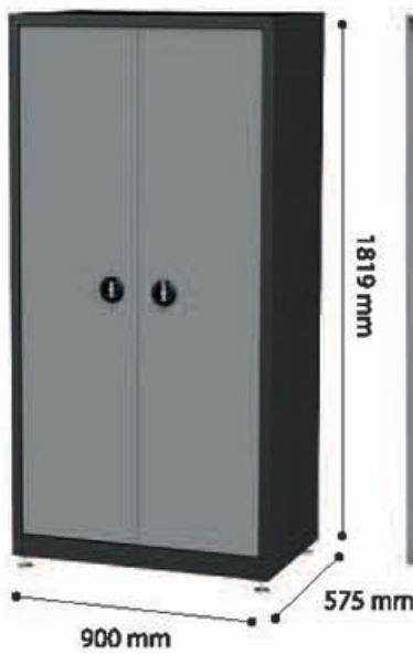
雙門置物櫃組 WS-LC18 (64-01) 900W x 575D x 1819H mm