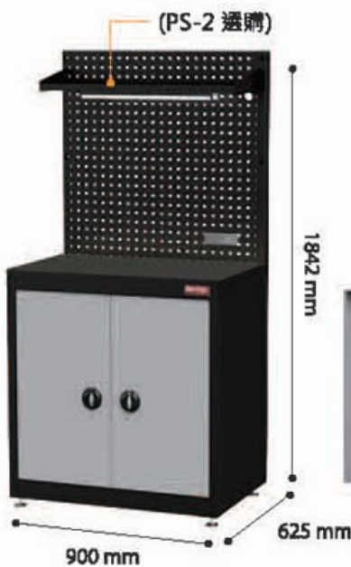
雙門置物櫃組 WS-ALI09 (64-03) 900W x 625D x 1842H mm