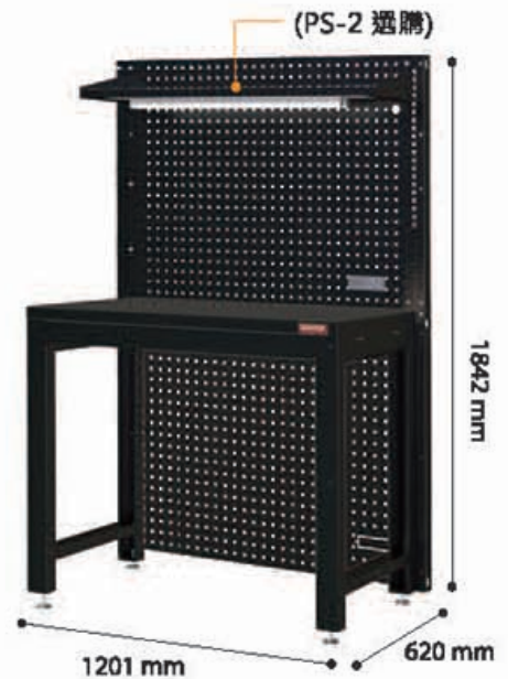
工作桌組 WS-AT12 (64-02) 1201W x 620D x 1842H mm 下方掛板需另外加購 (WSW12)