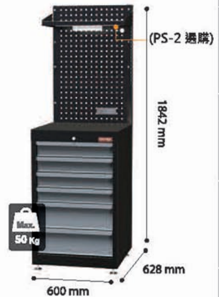
抽屜櫃組 WS-ADI06 (64-04) 600W x 628D x 1842H mm