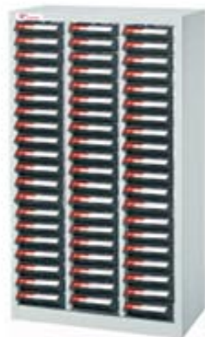
CA6-360P (113-05) 533W x 265D x 937H mm