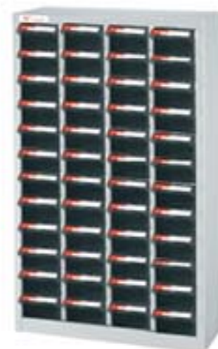
CA7-448 (113-10) 586W x 222D x 937H mm