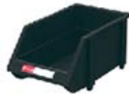
CHB-1525 (114-07) 150W x 265D x 121H mm