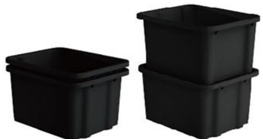
CA9-520 (114-11) 379W x 151D x 200H mm 抽屜內徑 63W x 134D x 37H mm