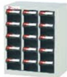
CA8-315 (113-12) 355W x 222D x 415H mm