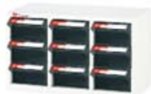
CA6-309H (113-02) 533W x 265D x 310H mm