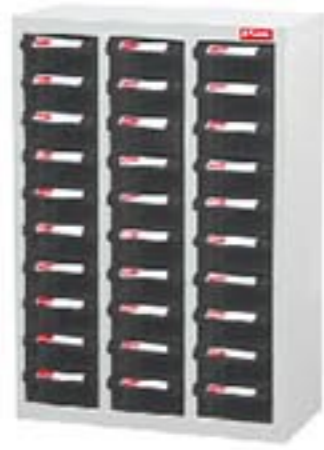
CST2-330 (114-01) 444W x 222D x 642H mm