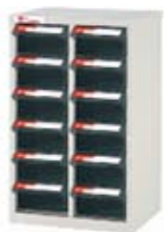
CA6-212H (113-04) 362W x 265D x 571H mm