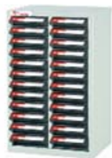
CA6-224P (113-03) 362W x 265D x 571H mm