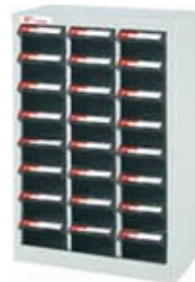
CA7-324 (113-09) 444W x 222D x 642H mm