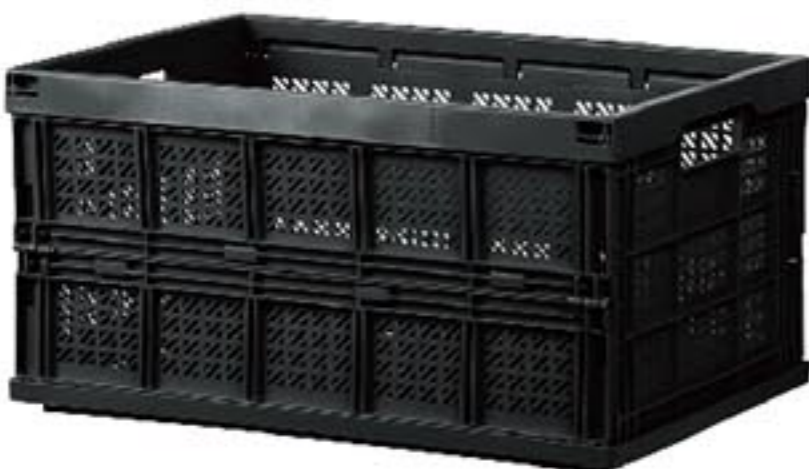
CFB-4531 (114-12) 455W x 310D x 240H mm