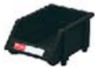
CHB-1218 (114-06) 121W x 180D x 84H mm