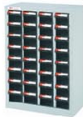
CA8-432 (113-13) 466W x 222D x 642H mm