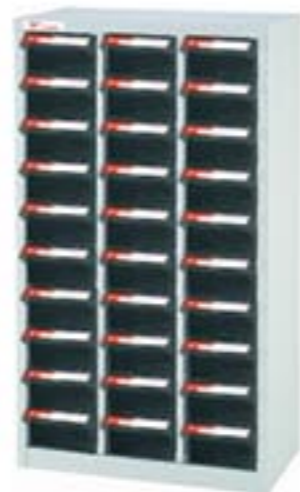
CA6-330H (113-07) 533W x 265D x 937H mm