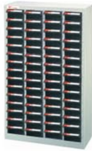
CST2-460 (114-02) 586W x 222D x 937H mm