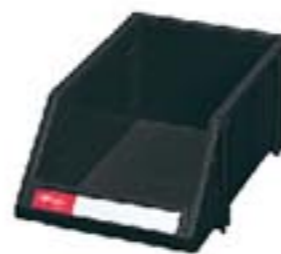
CHB-2035 (114-08) 208W x 353D x 155H mm