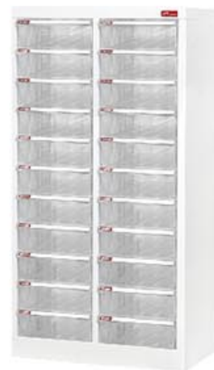
A3-222H (108-10) 710W x 450D x 1062H mm