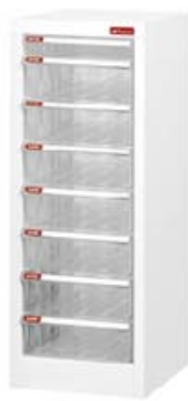
A3M1-7x1 (108-02) 370W x 450D x 740H mm