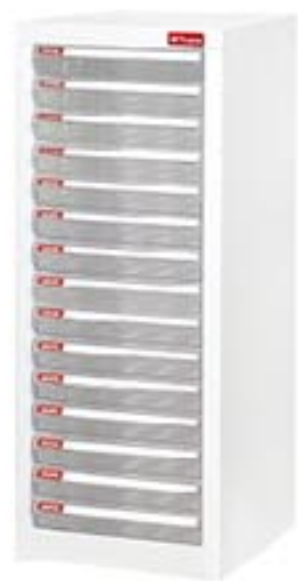
A3-115P (108-01) 370W x 450D x 740H mm