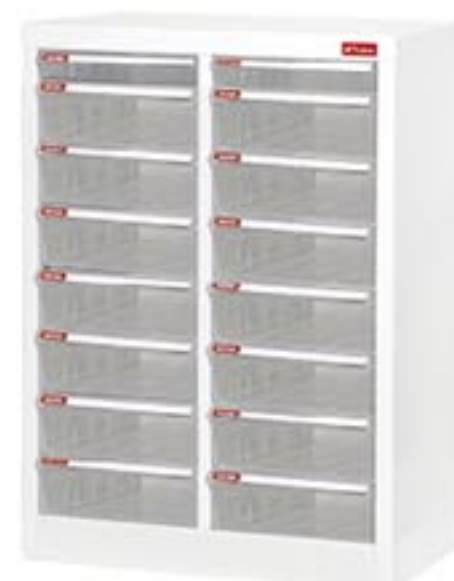
A3M2-14x2 (108-04) 710W x 450D x 740H mm