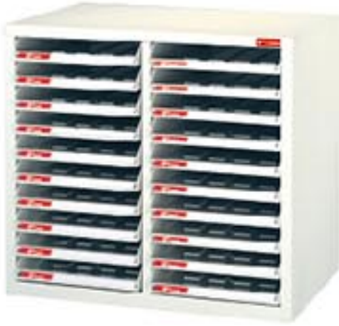
A4O-220P (110-05) 534W x 343D x 483H mm