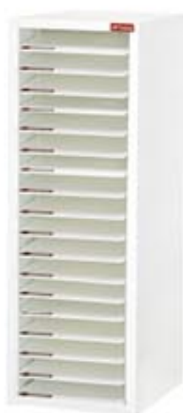
SA4-118P (109-13) 285W x 343D x 880H mm