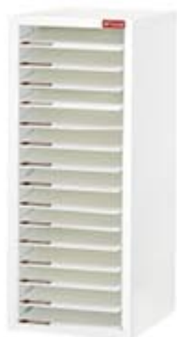
SA4-115P (109-06) 285W x 343D x 740H mm