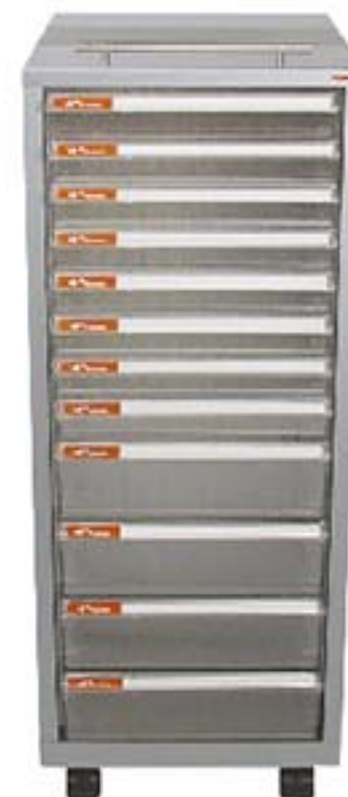
B4MD-4H8P (110-10) 320W x 410D x 820H mm