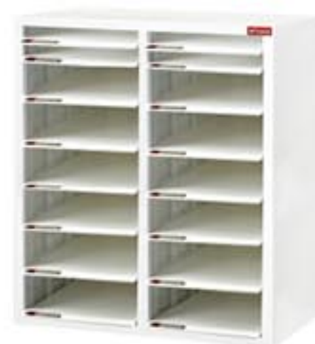
SA4M2-14x2 (109-09) 545W x 343D x 740H mm