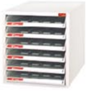
A4O-106P (110-01) 264W x 343D x 287H mm