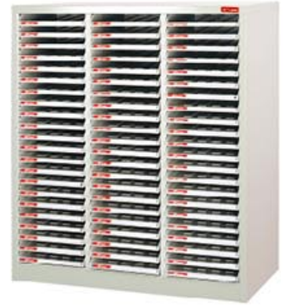
A4O-366P (110-08) 800W x 343D x 1062H mm