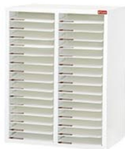
SA4-230P (109-08) 545W x 343D x 740H mm