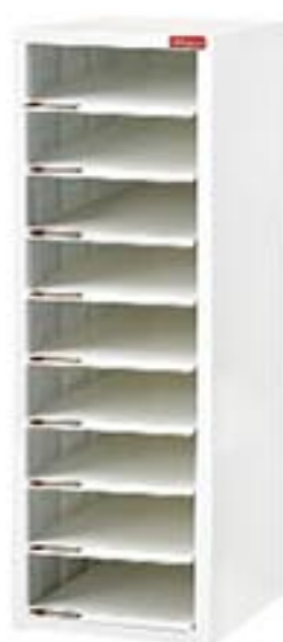
SA4-109H (109-14) 285W x 343D x 880H mm