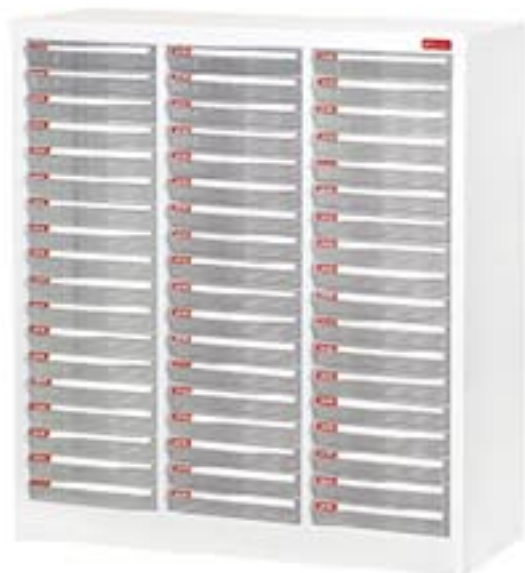
A3-345P (108-05) 1050W x 450D x 740H mm