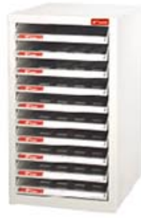
A4O-110P (110-02) 285W x 343D x 483H mm