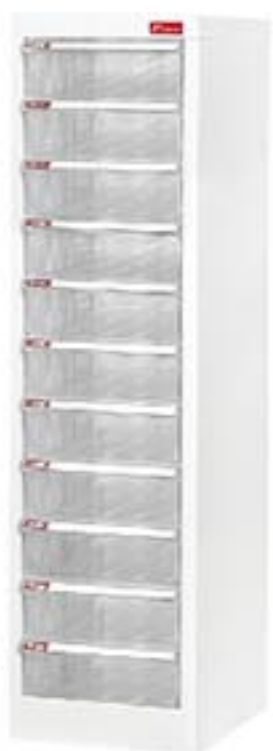
A3-111H (108-08) 370W x 450D x 1062H mm