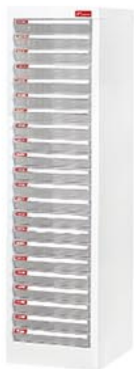
A3-122P (108-07) 370W x 450D x 1062H mm