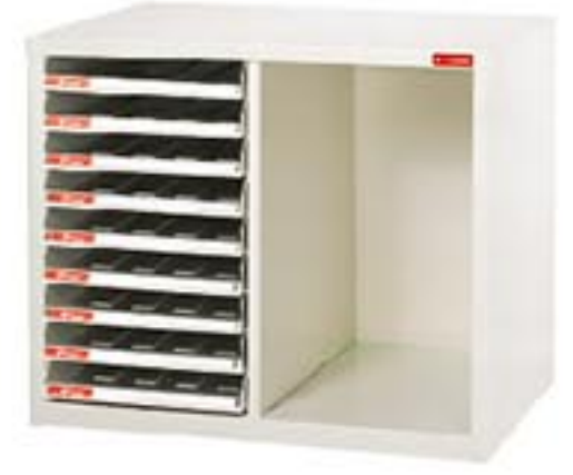
A4O-B209 (110-04) 534W x 343D x 440H mm