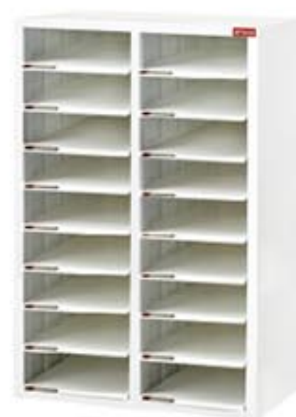
SA4-218H (109-16) 545W x 343D x 880H mm