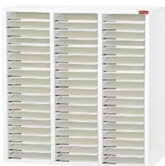
SA4-354P (109-17) 800W x 343D x 880H mm