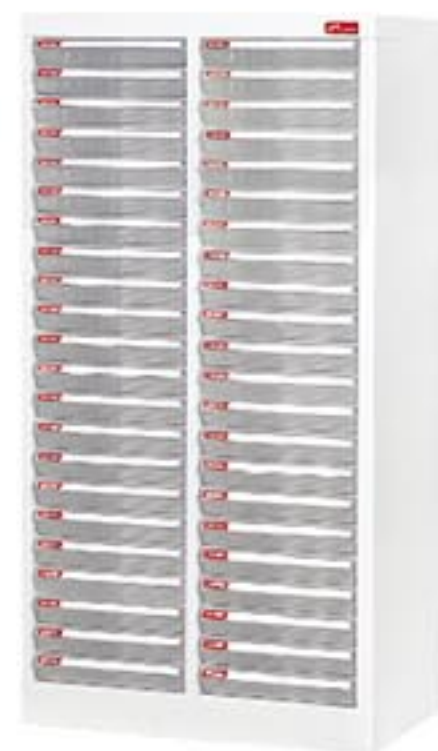
A3-244P (108-09) 710W x 450D x 1062H mm