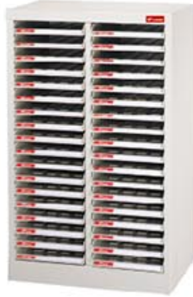
A4O-236P (110-06) 545W x 343D x 880H mm