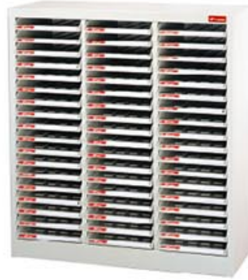
A4O-354P (110-07) 800W x 343D x 880H mm