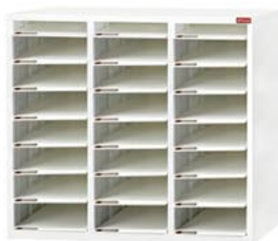
SA4M3-21x3 (109-11) 800W x 343D x 740H mm