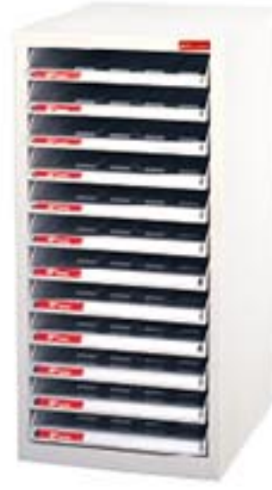
A4O-112P (110-03) 285W x 343D x 574H mm