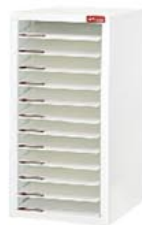
SA4-112P (109-04) 285W x 343D x 574H mm