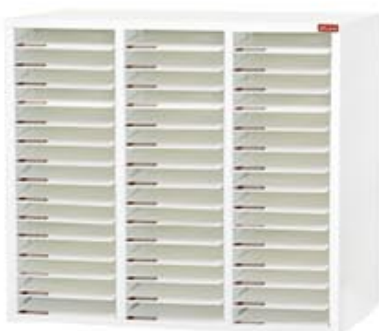
SA4-345P (109-10) 800W x 343D x 740H mm