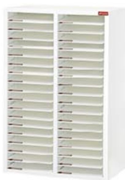
SA4-236P (109-15) 545W x 343D x 880H mm