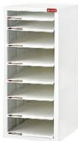
SA4M1-7x1 (109-07) 285W x 343D x 740H mm