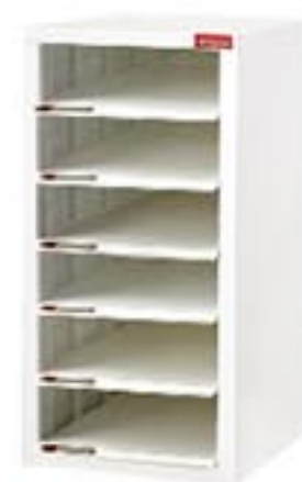
SA4-106H (109-05) 285W x 343D x 574H mm