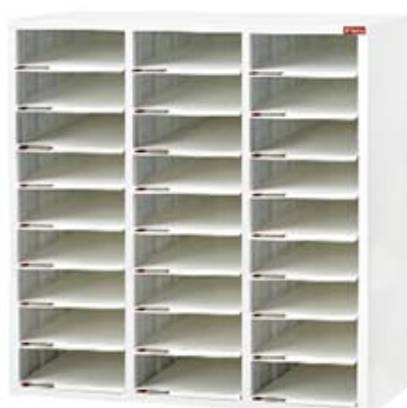
SA4-327H (109-18) 800W x 343D x 880H mm