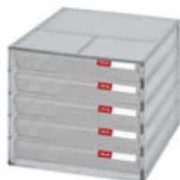
DD-105P (72-03) 250Wx340Dx230Hmm