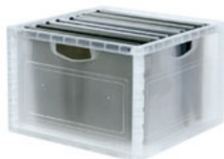
資料文件箱 Filing cube (包含6個懸掛式資料夾)

KD6F-2638 (74-01) 380Wx380Dx260Hmm 接單生產 MOQ: 50箱