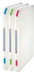
OF-A02 (73-02) 285Wx344Dx27Hmm 接單生產 MOQ: 100箱