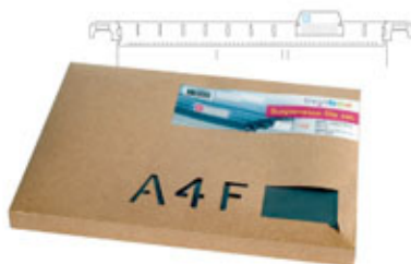
懸掛式資料夾補充包 PP suspension file pack (K/D available - including blank insert and tab/per piece)

A4-12F (74-03) 345Wx253Dx25Hmm 接單生產 MOQ: 1000組