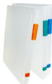
OF-B01 (73-03) 280Wx375Dx30Hmm 接單生產 MOQ: 100箱