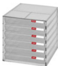
DD-106P (72-04) 250Wx340Dx230Hmm