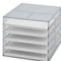
DD-105S (72-05) 250Wx340Dx230Hmm 接單生產 MOQ: 50箱